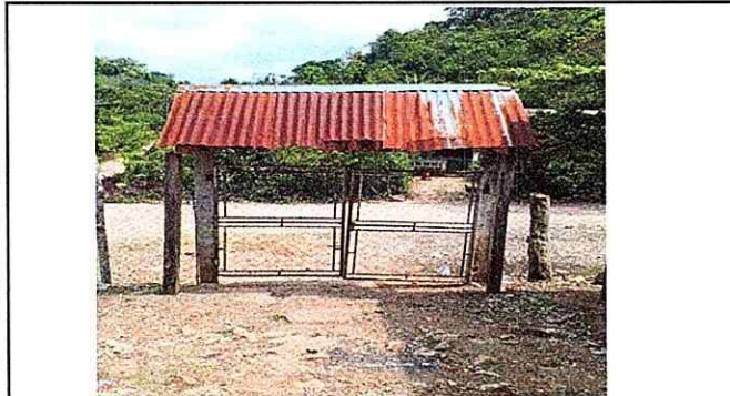
Foto 3: SUSTITUCION DE PORTON POR FALTA DE MANTENIMIENTO. ENTRADA PRINCIPAL DE LA ESCUELA.