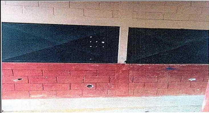
Foto 7: REMODELACIÓN DE LA COCINA DEBIDO A QUE LAS PAREDES CONTIENEN AGUJEROS.