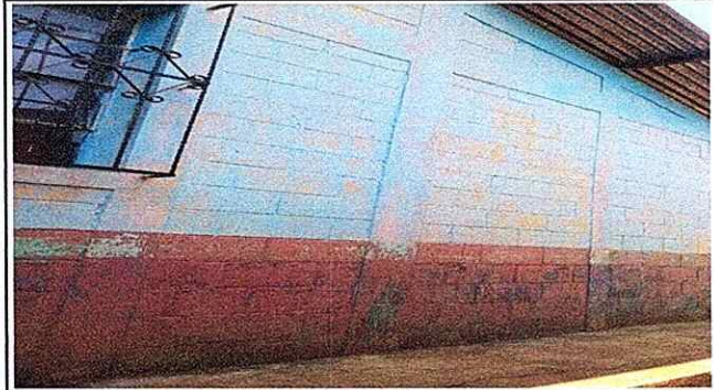
Foto 2: APLICACION DE PINTURA EN PARED POR FALTA DE MANTENIMIENTO