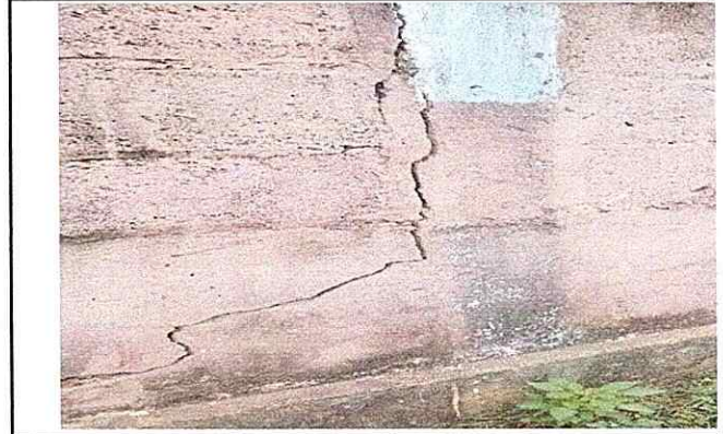
Foto 8: REMODELACIÓN DE LA COCINA POR MAL ESTADO DE LAS PAREDES ESTRUCTURALES.