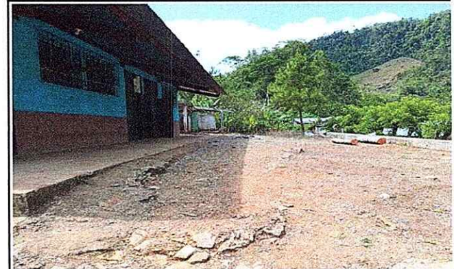
Foto 10: AMPLIACIÓN DE CORREDOR CUBIERTO DE LAMINA POR ESPACIO INSUFICIENTE PARA REALIZAR ACTIVIDADES.