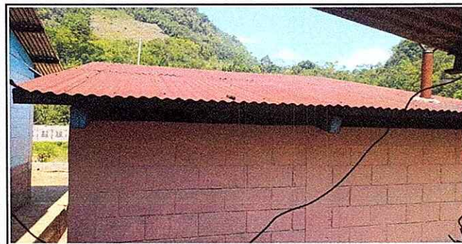
Foto 5. SUSTITUCION DE TECHO DE LA COCINA