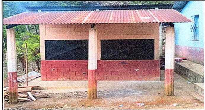
Foto 4: REMODELACION DE COCINA PARA MEJORAR LA ENTREGA DE LOS ALIMENTOS A LOS NIÑOS.