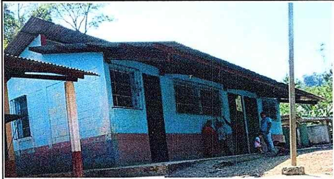
Foto 1: APLICACION DE PINTURA EN PARED POR FALTA DE MANTENIMIENTO