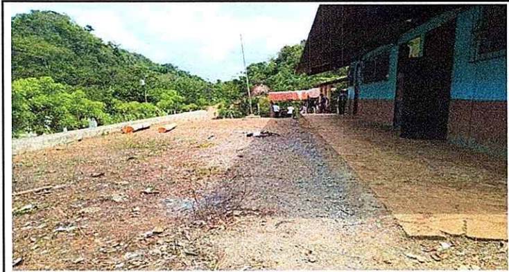
Foto 9: AMPLIACIÓN DE CORREDOR CUBIERTO DE LAMINA POR ESPACIO INSUFICIENTE PARA REALIZAR ACTIVIDADES.